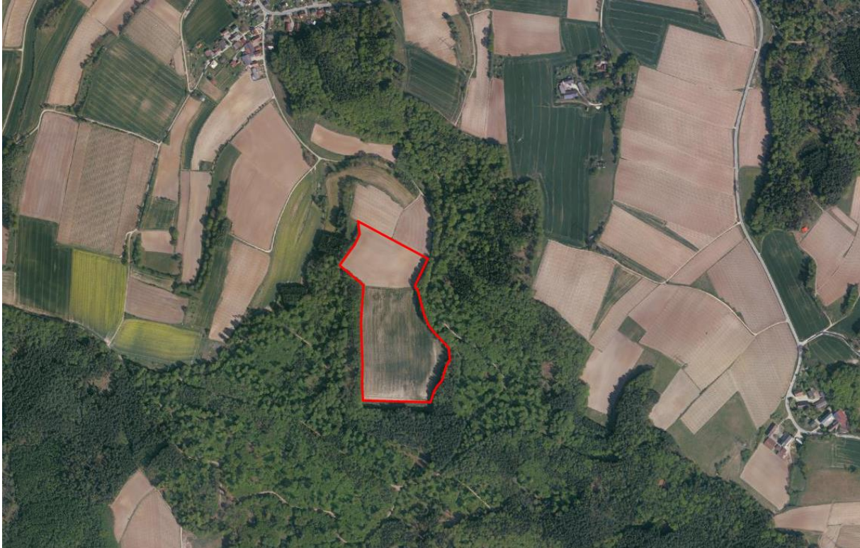
Landschaftsbild - rot umrandet: Geltungsbereich des Bebauungsplanes

Das Planungsgrundstück verfügt aufgrund seiner Topografie und seiner naturräumlichen Gegebenheiten über gute Bedingungen für die Errichtung und für den Betrieb einer Photovoltaikanlage und für die Minimierung möglicher Beeinträchtigungen des Landschaftsbilds.