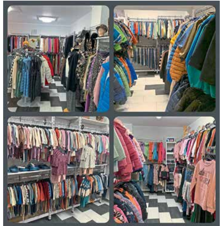
„Irenes Modewelt“ lockt mit satten Rabatten am Verkaufsoffenen Sonntag.

ten Farben sind eine wahre Augenweide. Vor Ort wurden die beliebten Weihnachtspflanzen aufgezogen – vom Steckling bis zur fertigen Pflanze. Keine Transportwege, ein ressourcenschonender Umgang mit Gießwasser und eine Produktion ohne den Einsatz von chemischen Pflanzenschutzmitteln: Das ist das „Geheimrezept“ für schöne und langlebige Weihnachtssterne, die auch noch durch Nachhaltigkeit bestechen. Bestechend schön sind auch die individuell gefertigte Werkstücke aus den geübten Händen des Floristenteams unter der Leitung von den Floristmeisterinnen Bettina Kellermann und Sabine Seidl. Sie begeistern durch handwerkliche Technik und ausgewählte Accessoires. Glanz und Glamour trifft bei den Adventsgestecken auf Naturprodukte, Weihnachtswich-tel und duftende Materialien. Handgebundene Ad-ventskränze in vielen Variationen und hochwertige Kerzen und Dekoartikel machen die Adventszeit für jedes Zuhause zu etwas Besonderem. Langlebige Weih-nachtssträuße und