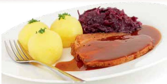
Zu bayerischen Schmankerln sind Gäste auf den Hagl-Hof eingeladen.