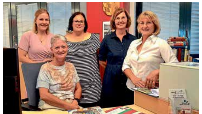
Das Team der Geisenfelder Stadtbücherei