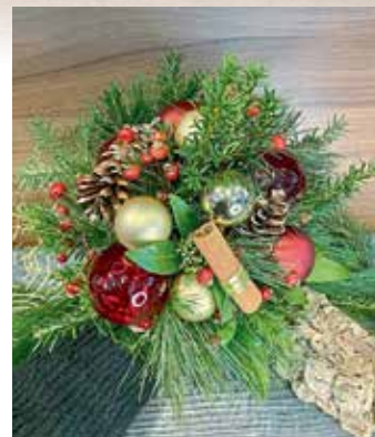
Traumhafte Adventskränze und weihnachtliche Gestecke gibt es bei „1A Garten €Eickelmann“.

Amaryllis in allen Varianten begeistern die Besucher. Die Adventszeit bei „1A Garten Eickelmann“ mit immer wieder neuen Werkstücken und Artikeln beginnt am Martinimarkt-Wochenende und endet am Dienstag, dem 24. Dezember um 12 Uhr. Apropos Mittagszeit: Am Martinimarkt-Sonntag gibt es natürlich in der Innenstadt einiges an Leckereien zu genießen. Wer sich nach dem Spaziergang durchs Zentrum oder auch davor gemütlich zum gut bürgerlichen Mittagstisch setzen möchte, dem sei der Hagl-Hof in Parleiten empfohlen. Am Wochenende lässt sich hier nach bayerischer Art und immer schon ab 11 Uhr