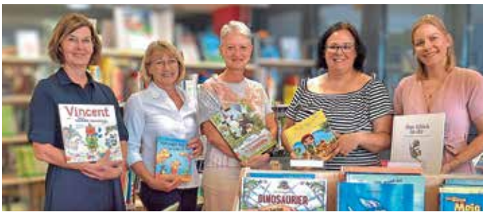
Das Team der Geisenfelder Stadtbücherei

Besonders motivierend: Wer seine gelesenen Bücher im persönlichen Journal dokumentiert und dieses bis spätestens 23. September abgibt, hat die Chance auf tolle Preise! Die Verlosung findet am Freitag, den 26. September 2025 um 15 Uhr in der Stadtbücherei statt. Als ganz besonderer Höhepunkt winkt dieses Jahr ein bayernweit einmaliger Sonderpreis: ein zweitägiger Familienaufenthalt im Europa-Park mit Besuch der Wasserwelt Rulantica. Viel Glück und vor allem: Viel Spaß beim Lesen!