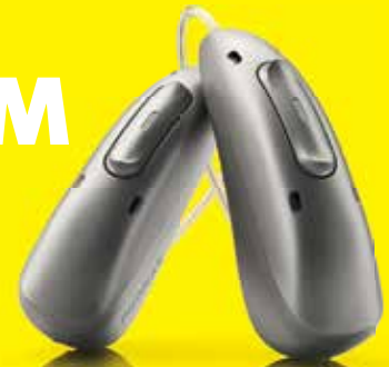
Phonak Audéo™ R Infinio