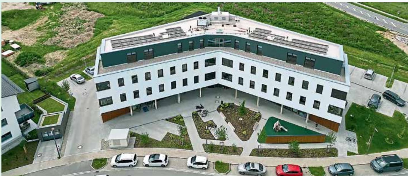
Aus der Vogelperspektive erkennt man, wie groß das neue Gesundheitszentrum Geisenfeld ist.

Und daher laden die beiden Initiatoren gemeinsam mit allen Mitstreitern nun zur feierlichen Eröffnung am Samstag, 13. Juli 2024, ein. An diesem Tag der offenen Tür sind alle Bürger von 10 Uhr bis 16 Uhr eingeladen, das Gesundheitszentrum kennenzulernen. Es erwartet die Besucher ein vielfältiges Programm und tolle Aktionen rund um das Thema Gesundheit. Um 11 Uhr sind Interessierte zur Eröffnungszereemonie mit Ansprache durch den Bürgermeister geladen. Anschließend wird das gesamte Gesundheitszentrum Geisenfeld vorgestellt. Bei der Willkommensfeier inklusive Kinderprogramm ist für jeden etwas geboten. Während sich Mama und Papa über die gesundheitliche Versorgung informieren, können die Kleinen auf der Hüpfburg toben, sich beim Kinderschminken in lustige Wesen verwandeln, oder auf