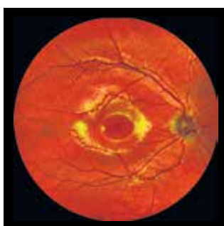
Bildaufnahme Augenschreibungs Funduskamera