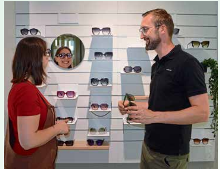
In der „Optikmeisterei“ berät das Team rund um Brillen, Sonnenbrillen, Kontaktlinsen und spezielle Migränebrillen.

Im Gesundheitszentrum befindet sich seit Eröffnung des Gebäudes auch eine Filiale des Ingolstädter Orthopädespezialisten „OTec-In“. Hier finden Patienten alles rund um Orthopädiertechnik und Prothetik. Für den Tag hat sich das Team auch um besondere Beratungsangebote bemüht. Interessierte sind herz-