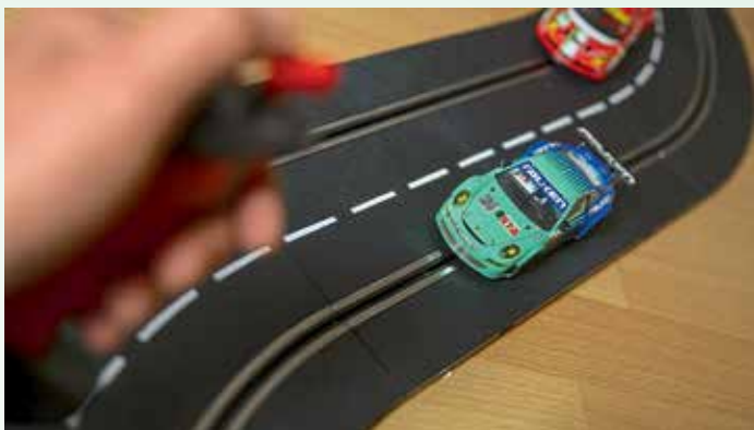
Eine große Carrerabahn stellt „Das Hörhaus“ für diesen Tag zur Verfügung.