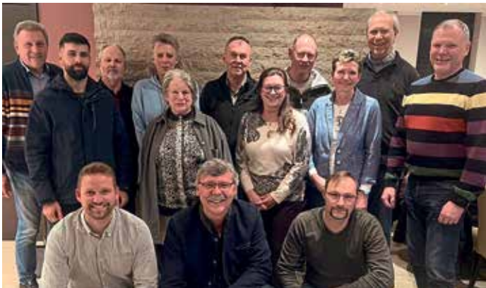
Die neue Vorstandschaft des Obst- und Gartenbauvereins (von links nach rechts):