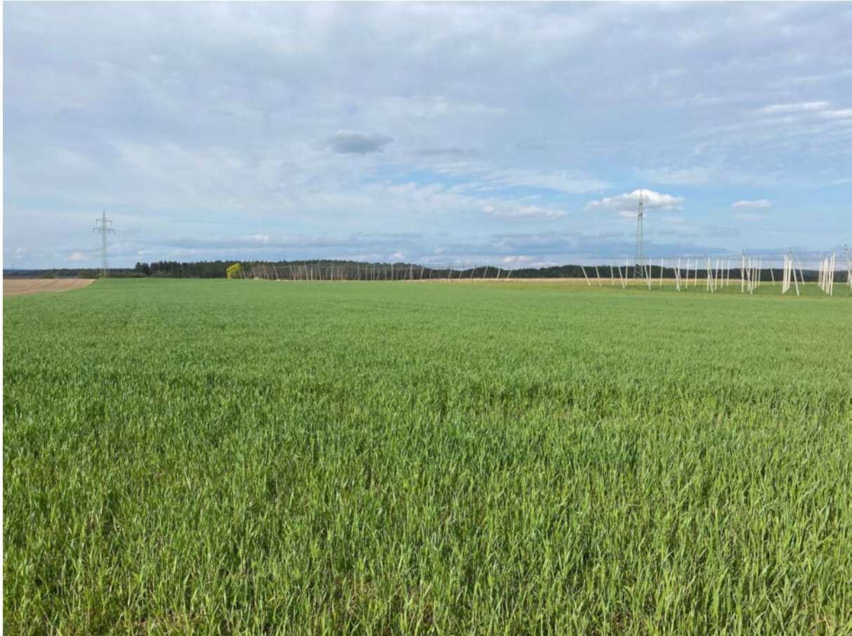
Blick auf den Standort der geplanten Photovoltaik-Freiflächenanlage. Das Gelände fällt im Norden ab.

muss die Fläche wieder landwirtschaftlich genutzt werden. Die Erhaltungsdauer der Ausgleichsflächen richtet sich nach den gesetzlichen Regelungen. Der Eingriff ist ausgeglichen, wenn die festgesetzten Entwicklungsziele erreicht sind. Dies ist abhängig von der sachgerechten Durchführung der Ausgleichsmaßnahmen. Die Erreichung der Entwicklungsziele ist von der Stadt in eigener Zuständigkeit zu überwachen.