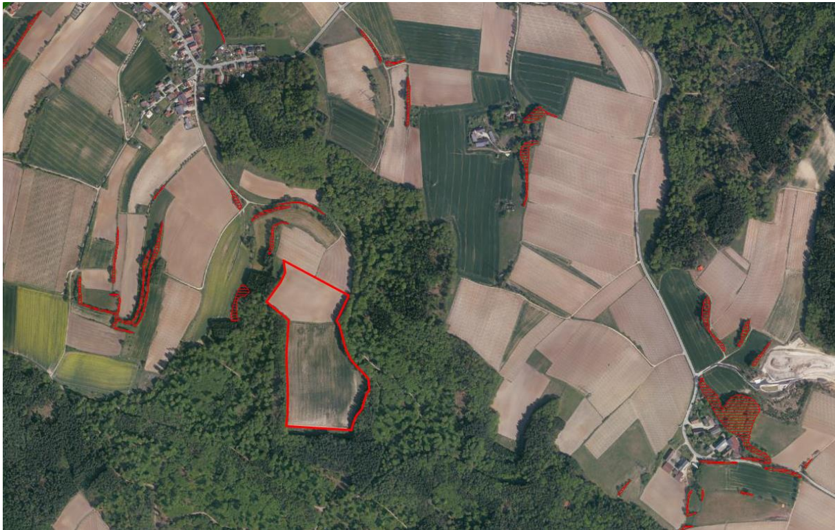
Abbildung 1: Auszug aus Biotopkartierung