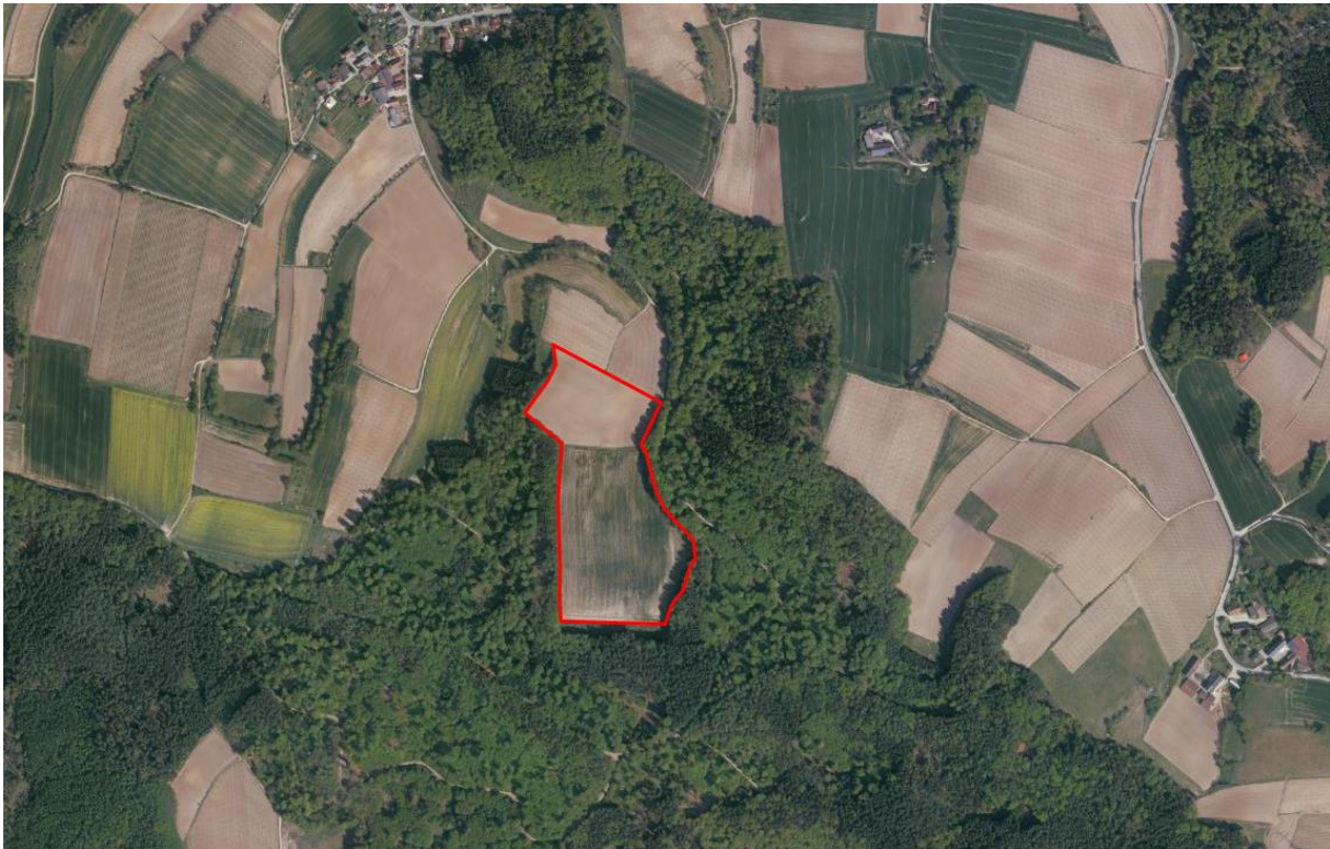
Landschaftsbild - rot umrandet: Geltungsbereich des Bebauungsplanes

Das Planungsgrundstück verfügt aufgrund seiner Topografie und seiner naturräumlichen Gegebenheiten über gute Bedingungen für die Errichtung und für den Betrieb einer Photovoltaikanlage und für die Minimierung möglicher Beeinträchtigungen des Landschaftsbilds.